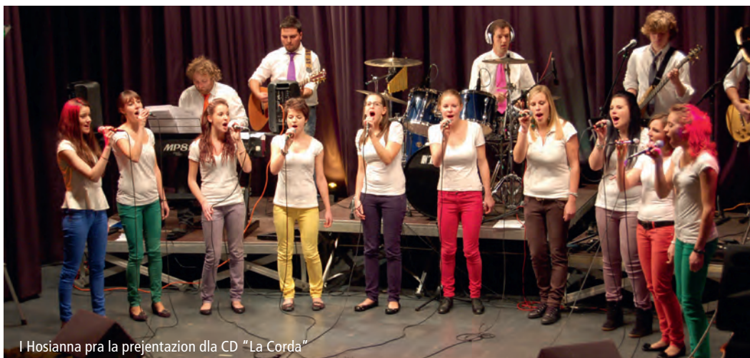
I Hosianna pra la prejentazion dla CD „La Corda”

La CD nstëssa possen cumpré pra i cumèmbri di „Hosianna” o sceno tla butèighes che vënd CD.