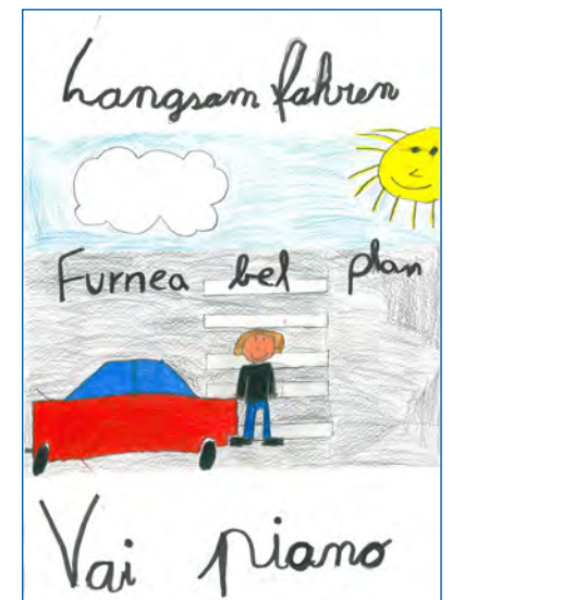
Dessèni de Dominik Demetz