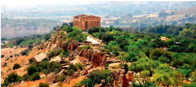
La Valle dei Templi

Ajache l ie debujèn de apustè bele sën la luegies sun l julier, prions bel de se nuté su riesc pra Rudolf Mussner , tel. 0471 794375.