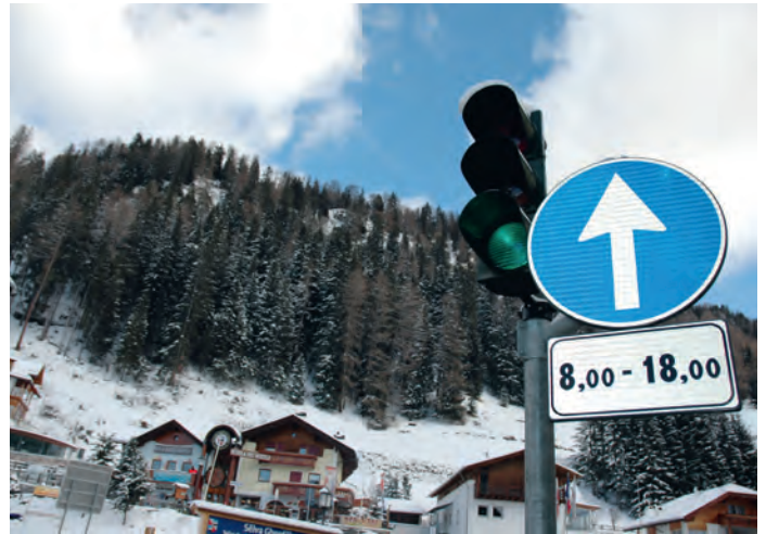
L semafer tala "Krone" ie inò n funzion.

L vën nce lecurdà de respeté i orars cun "disco orario" danter la 7:30 y la 8:30 sun n valguna lueges da parché; chësta regula va debujën per pudèi palé ora la luegia.