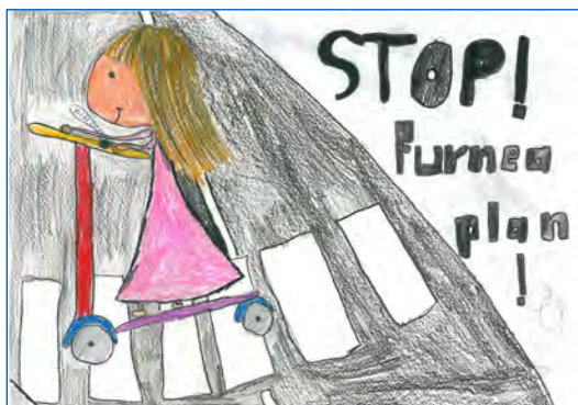
Dessèni de Planker Denise

La chemun de Sëlva ti à sëurandà ai 8 sculeies per si cuntribut de viers de chësta scumenciadiva de sensibilizazion a furné cun maniera dan ncrujedes y dantaldut dan la scoles ulache l ie strisces pedoneles na pitla recunescènza y ala scola elementera n bonn de 300 euro da spènder te na butèiga de nosc luech per fins che ti va a bèn di sculeies.