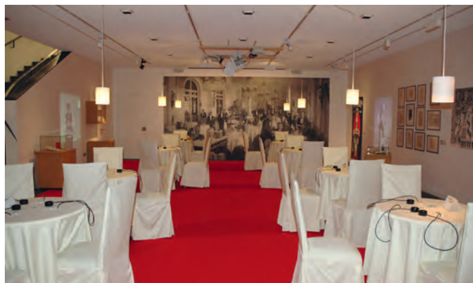
La mostra "Cie ëis'a gën?" vèn prejentada te na forma moderna interativa.

La mostra pieta na vijion dl svilup storich dl mestier da chelner y chelnera, de si cundizion de vester y de la