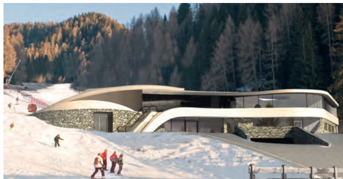
Nsci unirà a cialé ora la stazion a val nueva dl mplant Dantercëpies