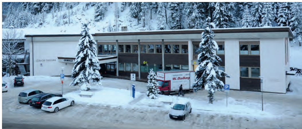
La Casa di Cultura verrà ristrutturata al fine del trasloco della scuola media.

La palestra scolastica comunale e la pista di pattinaggio nello sportstadion „Pranives“ sono gestiti dalla società „Pranives s.r.l.“, il Comune però ne assume le spese per determinate utenze, quando sussistano determinati requisiti previsti dal regolamento. La relativa spesa è stata vincolata in bilancio.