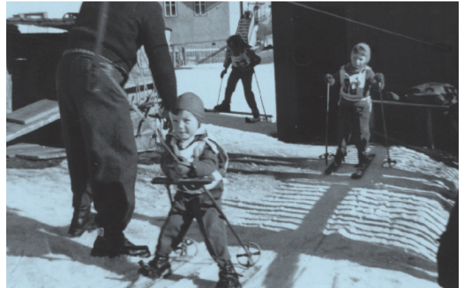
Garejeda di sculeies dl 1957 (lift da Frëina).

vel fotografia, copa, bedafia o vel auter lecord nteressant de l dé ju te scola elementera. Dut l material unirà sambèn retù tla mièur cundizions. N gra bel danora a duc chëi che meterà a disposizion velch.