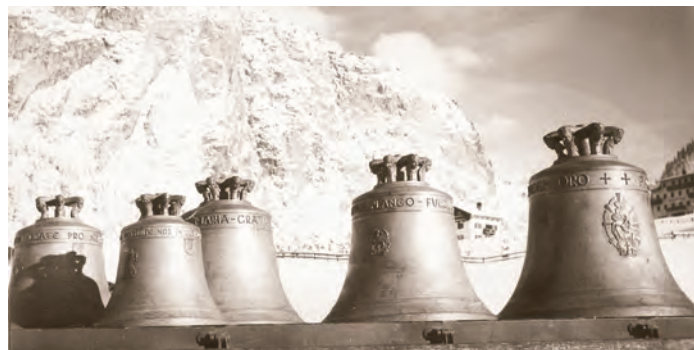
La ciampanes à dutes n'otra incijion, n auter tonn y n auter pëis.

de fier mudan ora chël de lën. Oradechël à nce fat lëures da eletricher fajan suné la ciampanes a motor y tulan demez nsci l gran lëur de suné la ciampanes a man. Chësta mudazions deberieda cun l gran pëis y al muviment ntan che l vën sunà la ciampanes (belau 2200 chilo) à purtà pro a avèi - cun l passé di ani - problems de statica per nosc ciampanil. Ajache l ie nce de gran sfëntes tla muredes de ciampanil à nciarià l inj. dut. Schütz de Kempten a muserè l muviment dl ciampanil ntan che l vën sunà.