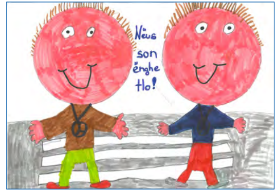
Dessèni de Christian Gasser

Sën sperons sambèn che chëi dai auti ebe plu respet y furneie plan canche i ruva dlongia la scoles y che i sculeies posse avèi manco festide; purmpò iel for da teni uedli y urèdles davierc canche n ie sun streda.