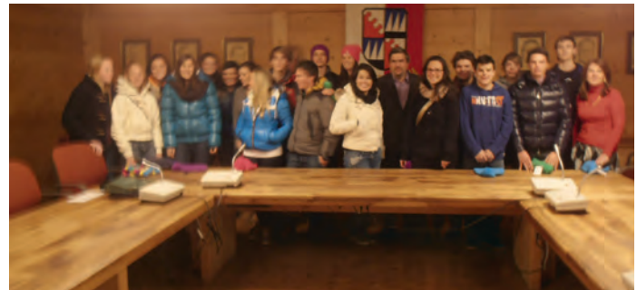
L ambolt rejona ai jèuni (foto dessëura) y foto de grupa.

dl fin dla NJG. Dadedò pudova i jèuni nstësc di ciche èi se aspjeta dal Chemun. Cun gran plajèi àn pudù cunstaté che i jèuni ie scial-