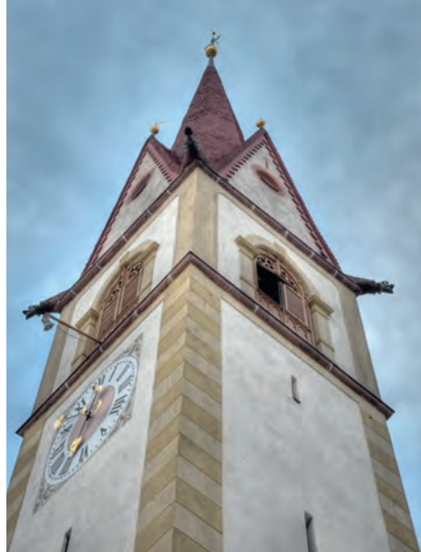
L ciampanil de Sëlva tira sfëntes y n messerà fé lëures per garanti la statica.

Purtruep iel sautà ora na situazion piecia de chëla che n se aspetova: la struttura di mures ne n'ie nia plu segura. A chësta maniera messoran cumedè su duta la struttura statica dl ciampanil y leprò nce mudè ora l mplant che tèn su la ciampanes (Glockenstuhl).