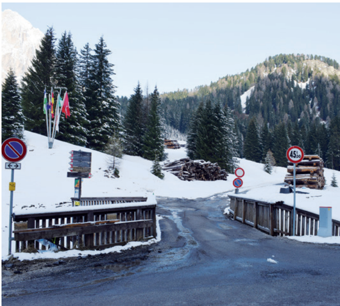
L uniràa fat danuef l puent che mëina via pra l "Busc dal'Ega".