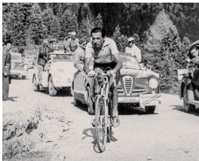
L atlet lejender Fausto Coppi su per l Jëuf dl Sella, ti ani '50

La cherta ie debant per duc chëi che à la residënza te Gherdëina y per i cunlauradëures de mprejes (partner atifs) che fej pea pra la scumenciadiva. L personal d'otra mprejes paia € 60,00 a sajon.