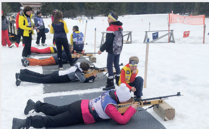
Tré tl scies; cun chësta cumpetizion se à mo mudà vel' tlassifica.

L regulamënt udova dant, che per uni colp tucà univel trat ju n secunt dal tēmp dl slalom, per uni colp falà n ruvoel un leprò. Chëi dal pudejé messova per uni colp falà fé mo na pitla raida de penalità o vel' penitēnza.