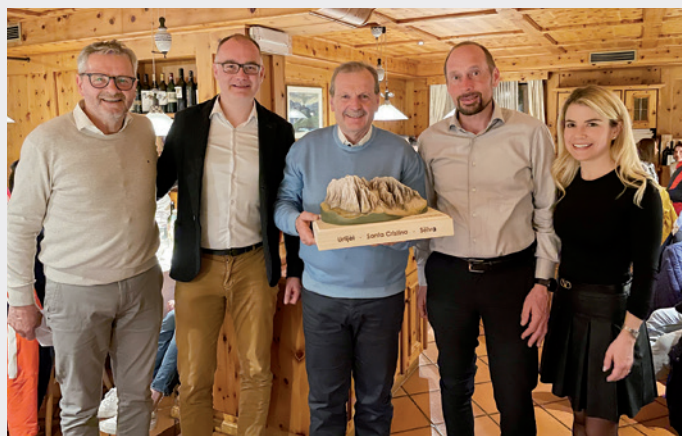
L ambolt de Sëlva cun l trofeo nuef, venciù dal Chemun de Sëlva