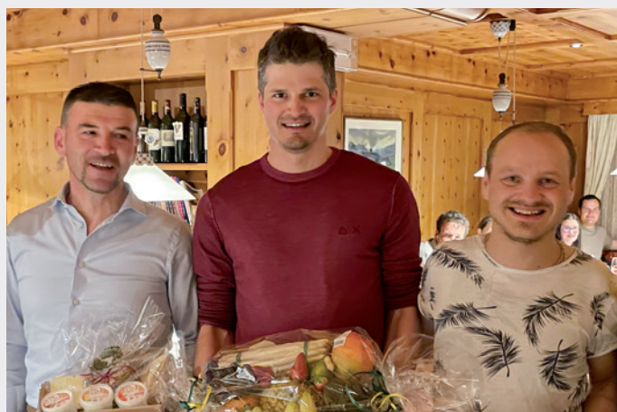
I miëures dla categoria "Èi da 36 ai 50 ani"