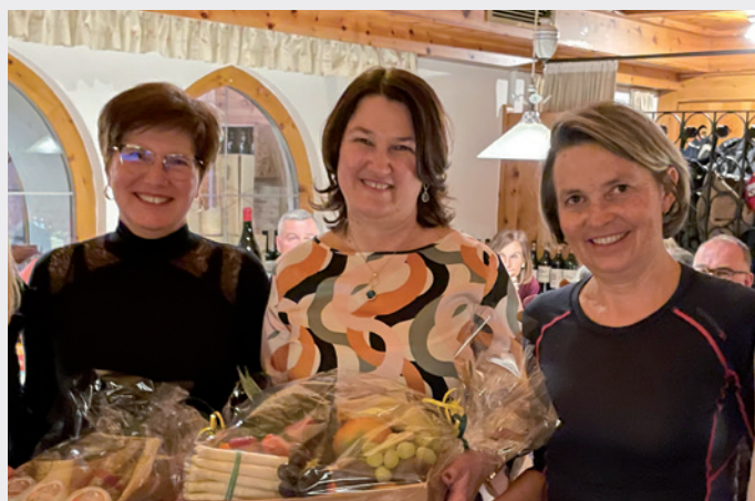
La miëures dla categoria "Èiles dai 51 ani insù"