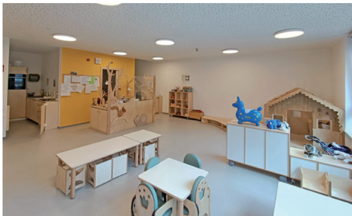
L'asilo nido dopo l'ampliamento

È approvato il certificato di regolare esecuzione, nonché l'allegato conto finale dei lavori per l' arredamento di interni dell'asilo nido dal quale risulta un costo complessivo dell'opera di € 58.703,35.