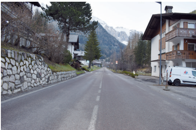
Sun la streda da Plan ite vèniel furnà massa debota; per schivé chësc y per garanti na majera segurèza, uniral fat vel'mudazion ala streda.

stredes. I tretuars ne unirà nia plu asfaleti ma fac de sa-lejà ("cubetti") Per asfalté la stredes val daniëura debujèn de n proiet y chësc ie uni fat dal dut. inj. Alfred Mick; udù dant iel na spèisa de 609.120,04 € per i ani 2024-2026.