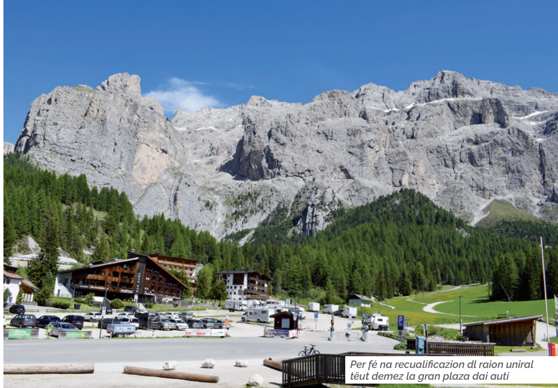
Per fé na recualificazion dl raion uniral t'èut demez la gran plaza dai auti