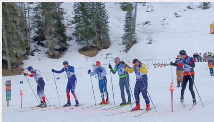
Garejeda de pudejé te Val... duc anjeniëi a pië via