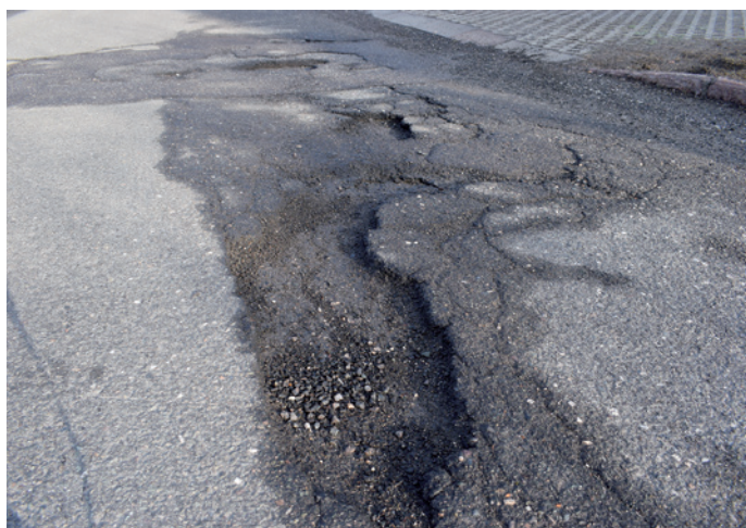
Stredes revinedes; l vèn dat ora truep scioldi per les cumedé.

Per chèst ansiuda iel udù dant de asfalté da nuef y cumedé ca n valgun toc de streda y plu avisa da curtina ite de viers dl hotel Olympia , tlo val nce debujèn de cuncé l tretuar, pona uniral fat da nuef l tretuar danter la plaza Nives y la cèsa de chemun y mo d'autri toc davia che per l "Giro d'Italia" val debujèn de mèter al ordn n valguna