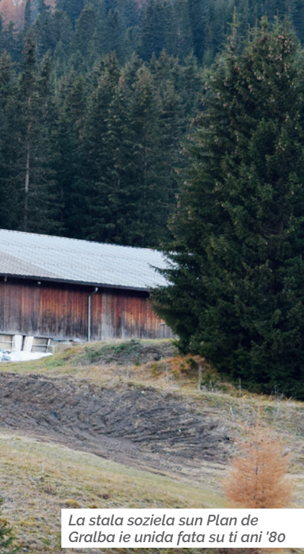
La stala soziela sun Plan de Galba ie unida fata su ti ani '80