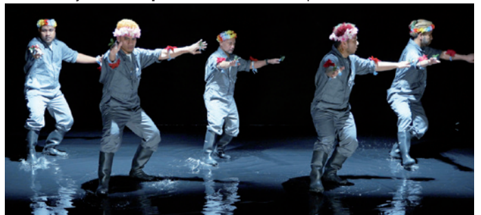
Pra "Overseas" uniral lascià ite ega te "Tublà da Nives".