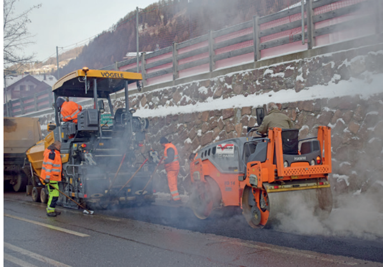
Asfaltatura di strade, una spesa cospicua per il Comune di Selva

Sono approvati i certificati di regolare esecuzione non-