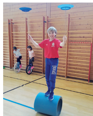
Die Schüler und Schülerinnen der 4. Klasse