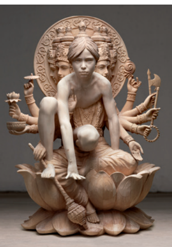
Na scultura de Gehard Demetz, che sarà da udëi te si mostra persunela ntan l mëns de agost.