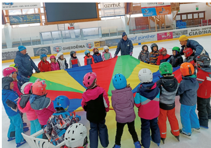
Giochi di gruppo su ghiaccio

Il 26 febbraio gli alunni e le alunne sono stati accolti da ex-atleti, nonché insegnanti di pattinaggio, che hanno proposto ai bambini dei giochi di gruppo divertenti ed esercizi di ogni tipo per migliorare l'equilibrio e la tecnica del pattinaggio. Per i bambini è stata una bellissima esperienza. Hanno potuto simulare la guida di macchine veloci, la visita alla casa stregata e giocare a hockey nel piccolo gruppo. Soprattutto i più piccoli hanno scoperto come muoversi meglio sul ghiaccio attraverso i giochi di ruolo. Parecchi di loro sono stati invogliati a ripetere quest'avventura sul ghiaccio in occasioni extrascolastiche coinvolgendo anche la propria famiglia. Speriamo vivamente che questo progetto venga riproposto anche in futuro alle scuole interessate.