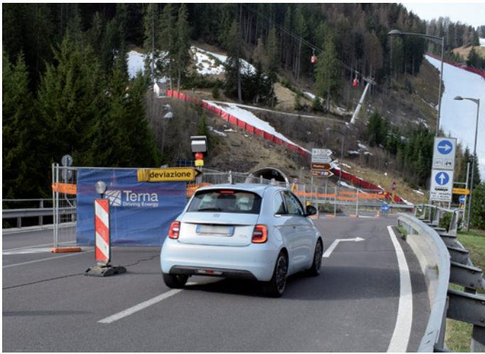
Deviazione in prossimità della galleria in zona Dorives